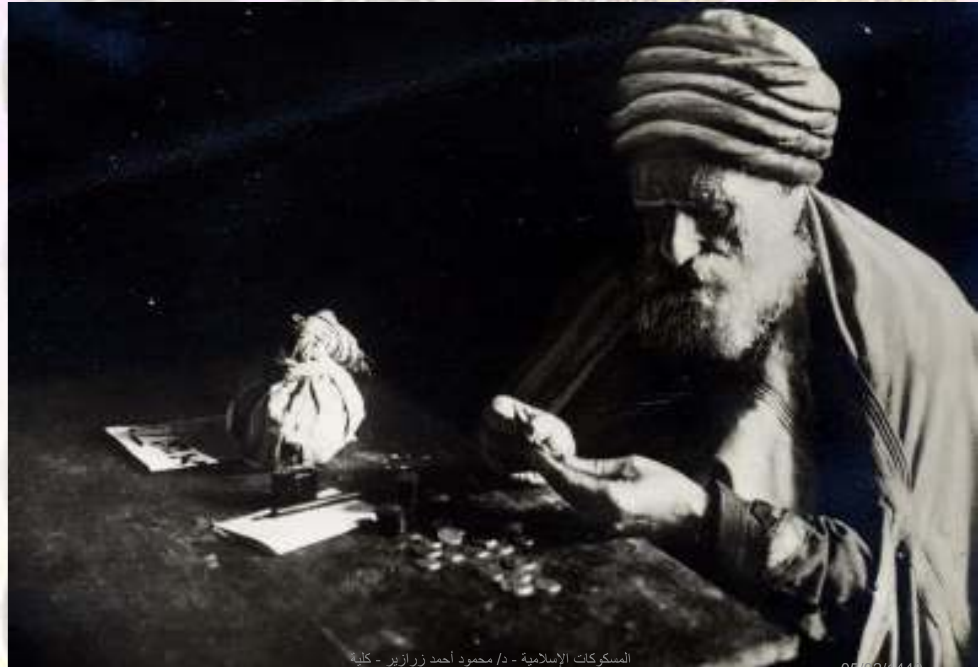
المسكوكات الإسلامية - د/ محمود أحمد زراير - كلية الأثار جامعة سوهاج الجزء الأول